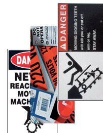
Maquinaria e Instalaciones

Las nuevas tintas y cabezales de avanzada tecnología, permiten a la nueva VP495 conseguir gráficos de alta calidad , códigos de barras y textos bien definidos gracias a su alta resolución de 1200x1200 dpi – resolución desconocida para cualquier otra impresora en el mercado hasta la fecha, basada en tintas de pigmento.