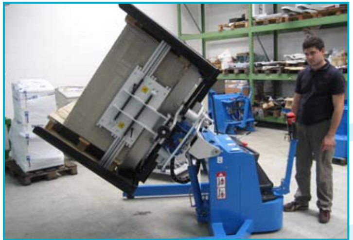
● ARGO AIR avec plate-forme retourne-pile mobile à air avec égalisation ARGO AIR con plataforma volteador de pilas móvil con aire y alineación