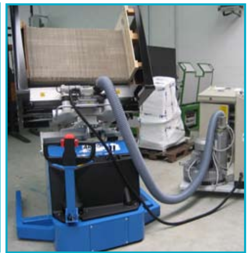
● ARGO AIR retourne-pile mobile avec air et égalisation ARGO AIR volteador de pilas móvil con aire y alineación