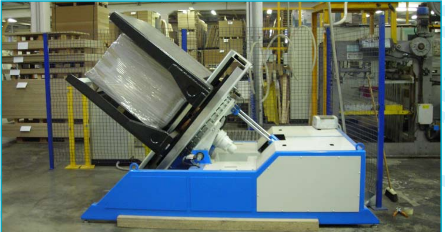
● GRIZZLY uniquement retourne-pile fixe GRIZZLY sólo volteador de pilas fijo