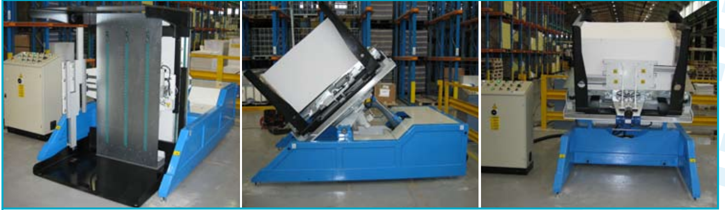
● GIBLI retourne-pile fixe avec air et égalisation GIBLI volteador de pilas fijo con aire y alineación